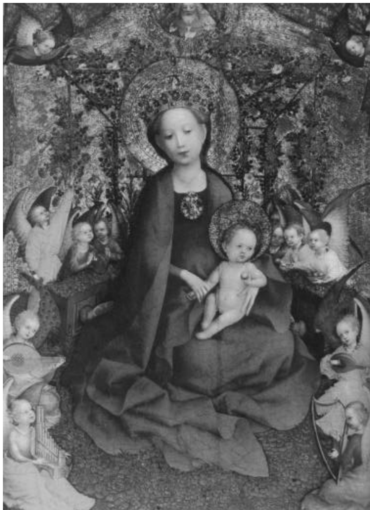
Weihnachten – Christi Geburt

Ein jegliches hat seine Zeit, und alles Vorhaben unter dem Himmel hat seine Stunde. Prediger 3, Vers 1